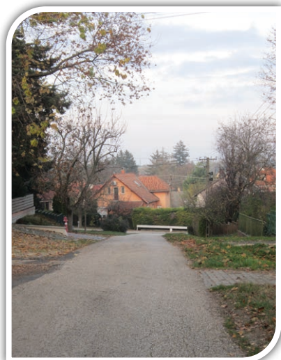
Kosztolányi Dezső utca ma

Hogy miért ment át nagyobb változáson, azt rögtön ecsetelni fogom. A táj természeti adottsága ahhoz, hogy a néptelenül lévő területet be lehessen építeni, majd lakni, telkeket kialakítani, hosszas földmunkát igényelt. Elsősorban a vadcseresznyésnek nevezett részen / ma Kosztolányi utca és a belőle nyíló utcák/ végighúzódtak árokrendszert kellett felszámolni. Az nemcsak a magasabb részeiről vezette le a csapadékot, hanem a talajszintcsökkenő magassága miatt egészen a mai Erdei utcáig alakította a területet. A szintkülönbségek megzabolázása után lehetett hosszanti és keresztirányú közutakat létrehozni. A Dózsa György út sztráda felőli oldalán egy nagy gödör várta a beépítést. Ezen a két területen nagyobb tervek és munkák segítségével kulturált egységeket hoztak létre.