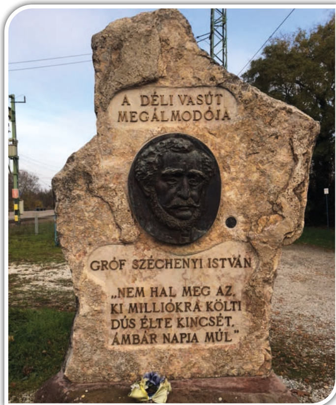
Széchenyi István emlékműve

Elhagyva a Rózsakert ABC-t, hamarosan elérünk a vasútállomáshoz vezető úthoz. Az aligai állomás épületében két szolgálati lakás is volt, amelyben a mindenkori állomásfőnök és családja, valamint más vasúti alkalmazottak laktak.