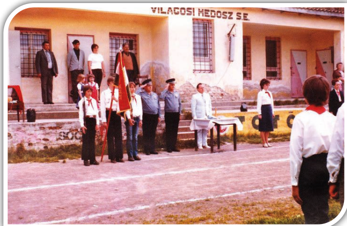
Iskolai ünnepély a régi pályán

focicsapatnak szurkolhattak a lakosok. Családostul sétáltak a pálya körül lévő ülőhelyekhez. A vasúttól a pályáig tartó lejtőn lépcsőzetesen kis padsorokat alakítottak ki. Ma már buja növényzet lepi el ezt a területet. A pálya másik felén állt az öltöző és illemhely épülete. A helyi focicsapat neve is változott az évek alatt, 1969-ig Balatonaligai SE, majd 1973-ig Balatonaligai MEDOSZ SE volt. (Forrás: www.magyarfutball.hu ) A focipálya az államosítás után került a MEDOSZ (Mezőgazdasági és Erdészeti Dolgozók Szakszervezete) tulajdonába, később a Balatonaligai Állami Gazdaság kapta meg. A gazdaságban dolgozó fiatal férfiakból verbuválódott a csapat, a gazdaság buszával vitték őket a meccsre és a mezeket is ők vásárolták a csapat tagjainak. Az 1969. április 30-i Napló újság sportrovatában a következőket olvashatjuk: A megyei labdarúgó bajnokságon pontot veszített a VKSE Balatonaligán. A péti csapat legyőzése után jó játékkal fékezte le a helyi csa-