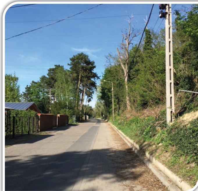
Rákóczi út ma

A Rákóczi úton télen nagy a csönd, nyáron nagy a nyüzsgés. Az élet itt is úgy hullámzik, ahogyan a természet lüktetését átéljük minden évben.