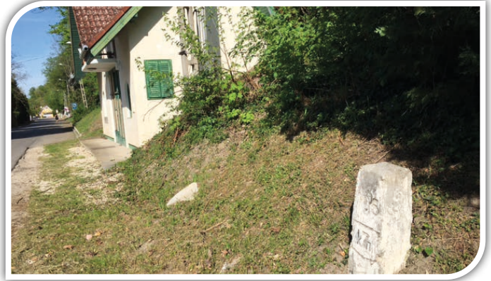
Kilométerkő (105) borozóval

1928-ban a telep régi óhaja teljesült, hogy Aligán és Világoson keresztül állami út készült. Ezúttal remélhetőleg