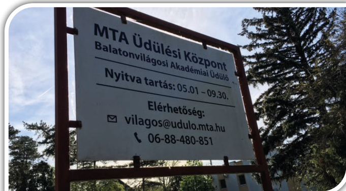
Magyar Tudományos Akadémia „cégére” ma

Arra a kérdésre, hogy milyen az élet itt most (egy 6 éve zömében helyben élő lakost kérdeztünk), a válasz egyértelmű volt: jó! Jó, mert tiszta a levegő, sportolásra alkalmas a környezet. Lehet kerékpározni, nagyokat sétálni. A mindennapokhoz szükséges vásárlás nehezebb, vonatra, buszra kell szállni vagy kocsiba kell ülni, mert itt nincs bolt.