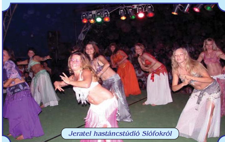
Jeratel hastáncstúdió Siófokról