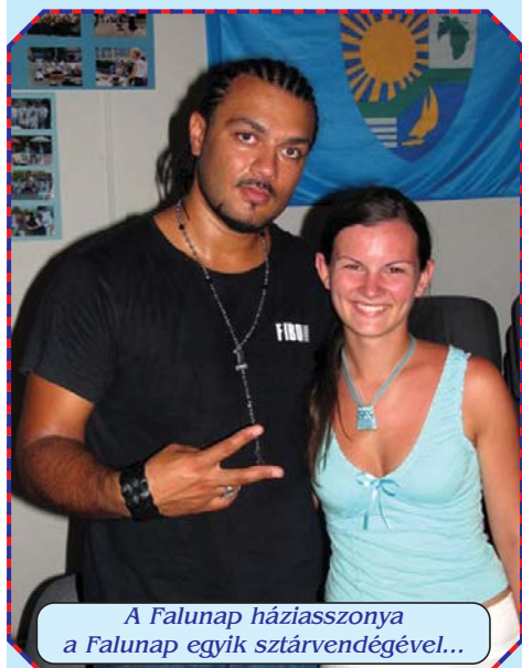
A Falunap háziasszonya a Falunap egyik sztárvendégével...