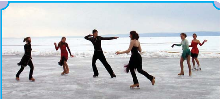
... és így indulhat a jégtánc-kavalkád...