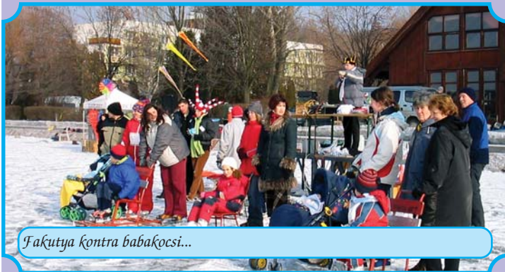
Fakútya kontra babakocsi...