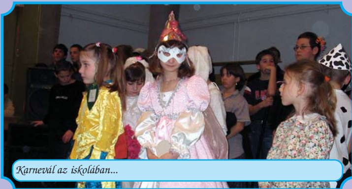
Karnevál az iskolában...