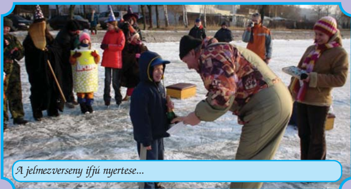
A jelmeztverseny ifjú nyertese...