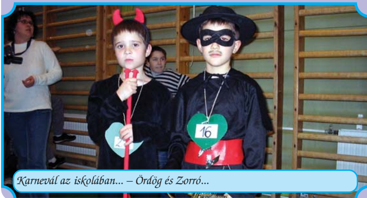
Karnevál az iskolában... - Ördög és Zorró...