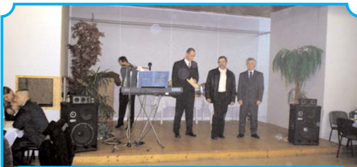
A balatonkenesei rendőrőrs parancsnoka és az alpolgármester nyitották meg a bált