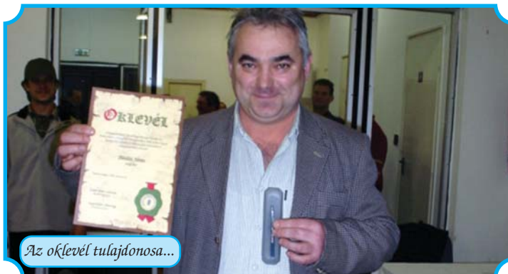
Az oklevél tulajdonosa...