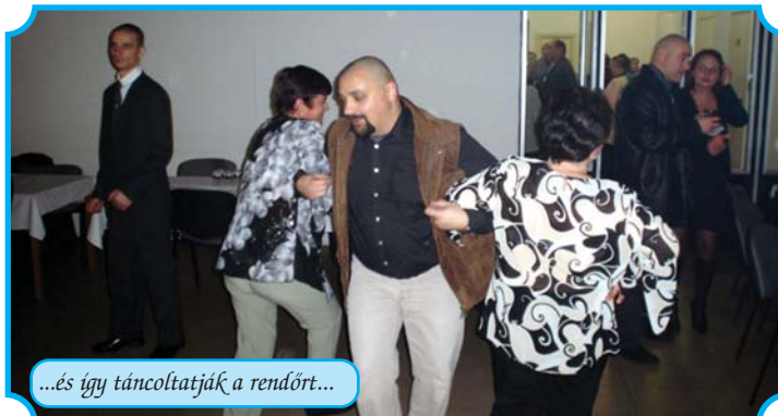
...és így táncoltatják a rendőrt...

Idén is megrendezésre került a hagyományos jótékonyági polgárőrbál. Az önkéntes csapatnak ez az egyetlen lehetősége a pénzszerzésre. Szerencsére a sok jóindulatú támogatónak illetve a sok szórakozni vágyónak köszönhetően sikerrel zárhattuk az idei báli szezont. A belépőkből és a tombolaárusításból befolyt bevételt benzinre fogjuk fordítani. A lap hasábjain keresztül mondunk köszönetet mindazoknak, akik eljöttek, reméljük, jól érezték magukat. Köszönetet mondunk mindazoknak, akik