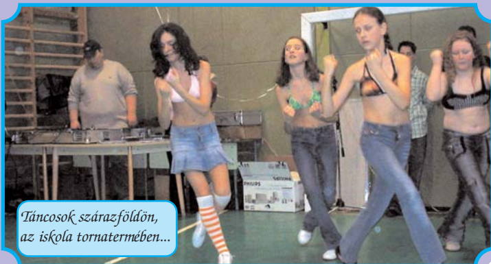
Táncosok szárazföldön, az iskola tornatermében...