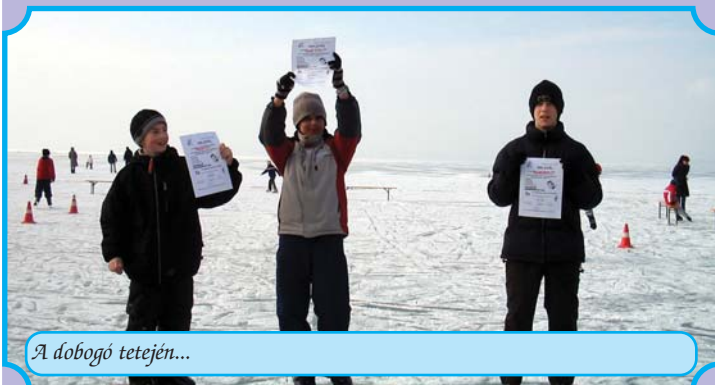
A dobogó tetején...