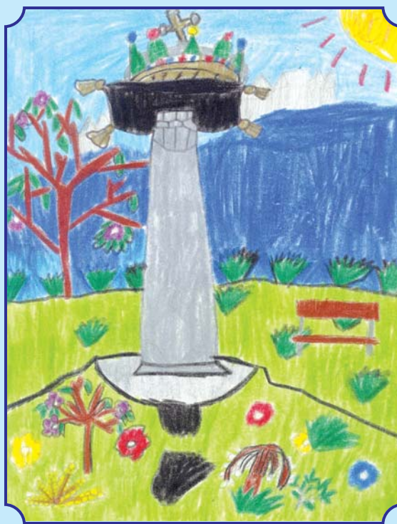
Vörös Roland rajzai 4. osztályos tanuló