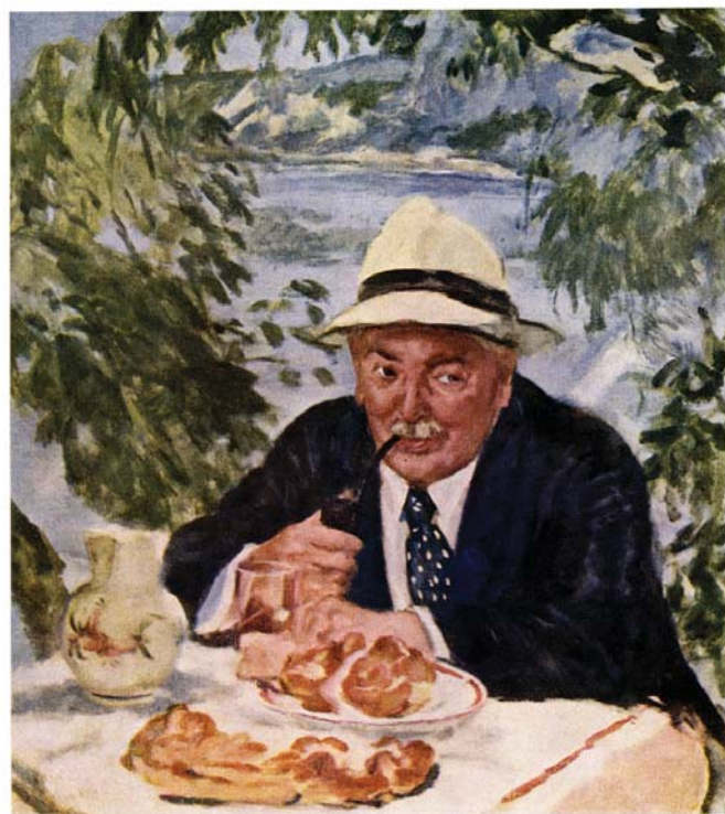
Csók: Keresztapa reggelije