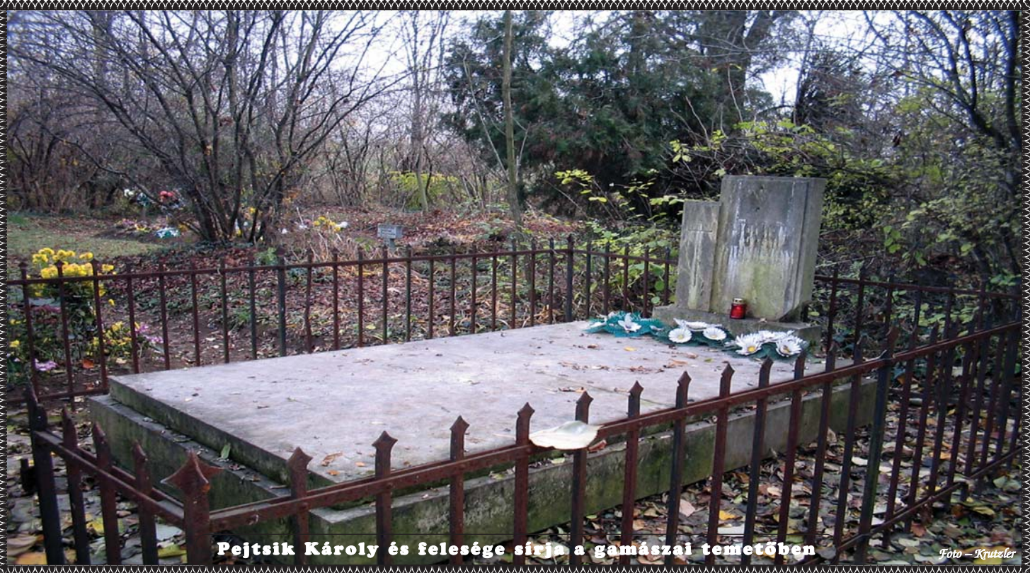
Pejtsik Károly és felesége sírja a gamászai temetőben