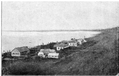
Világos: A telep alsó része. 1902 körül