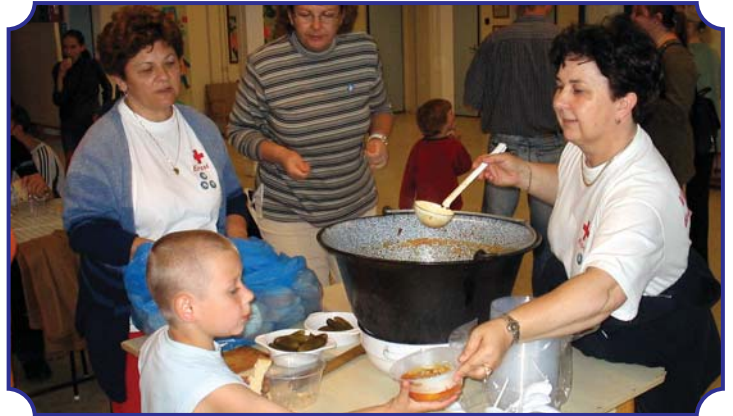
Kitűnő volt a vendéglátás