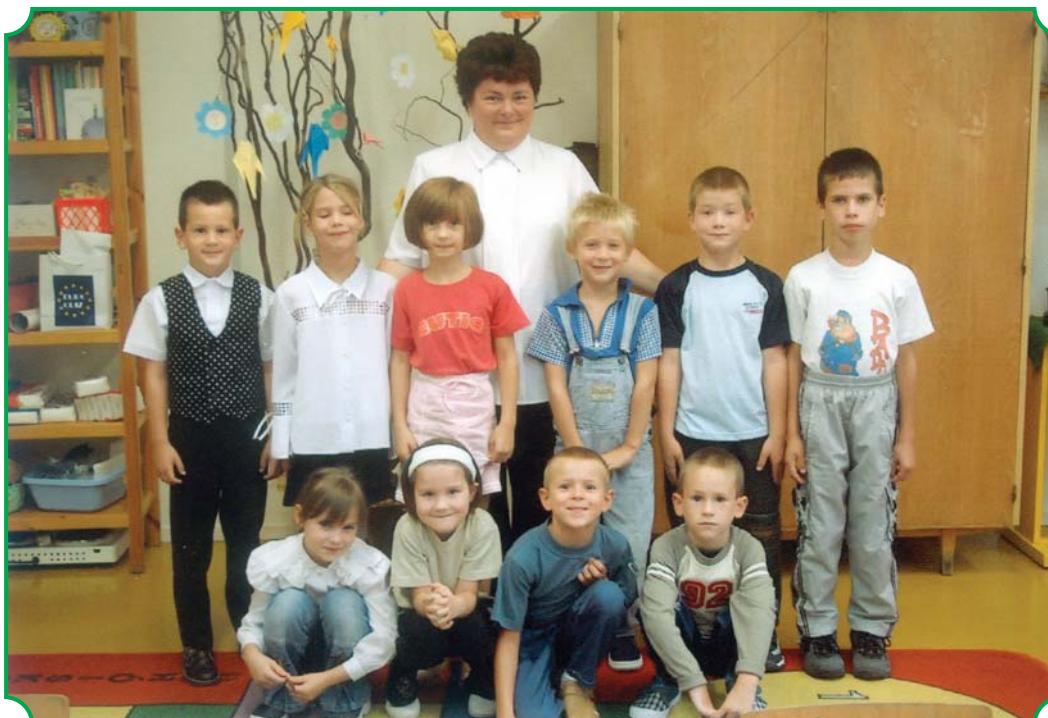
Az idei első osztály